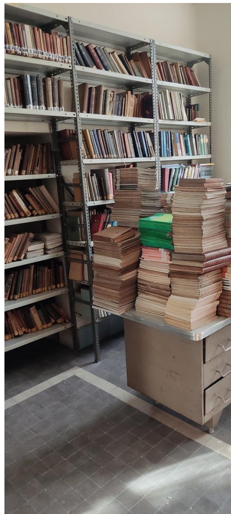
Depósito de fondos V

Una biblioteca y una institución que tienen 170 años a sus espaldas, y cuya historia se refleja inmediatamente en su edificio, de finales de los treinta, ejemplo de arquitectura racionalista, en sintonía con una enseñanza más moderna.