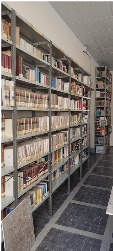
Depósito de fondos IV