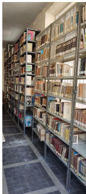
Depósito de fondos I