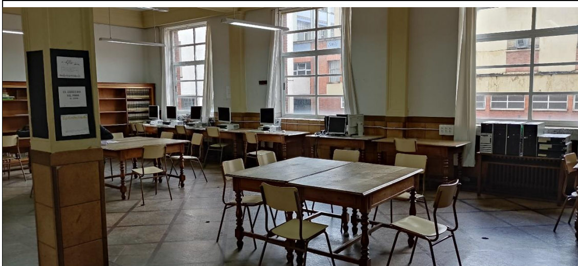
Vista parcial de la Sala Principal de la Biblioteca (dcha.)