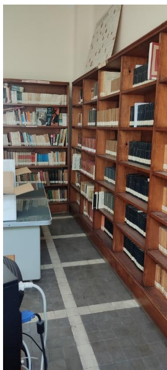
Depósito de fondos II