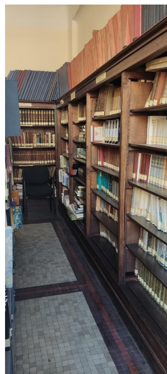
Depósito de fondos III